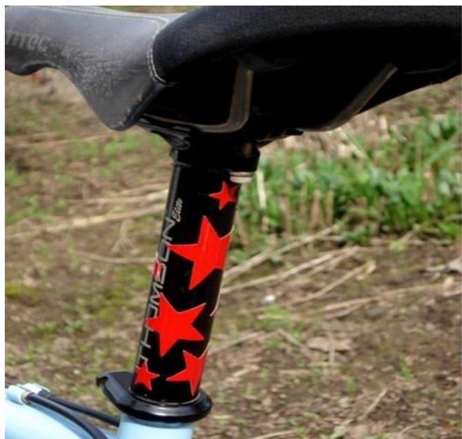
Рис. 4. Световозвращающие наклейки.