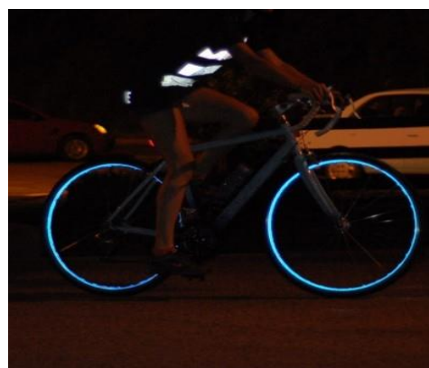
Рис. 10. Нашивки из световозвращающей ленты