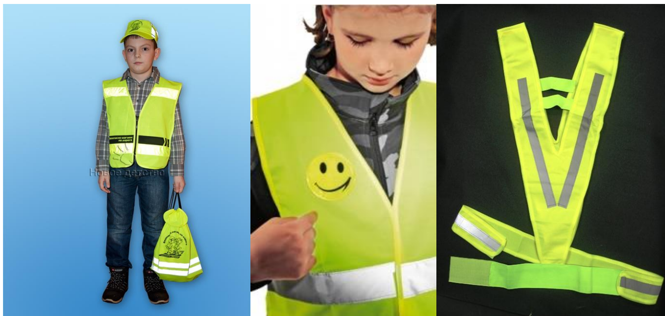
Рис.5. Сигнальные жилеты и ременные системы