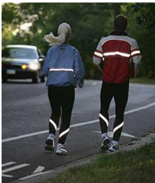
Рис.6. Несъемные световозвращающие элементы